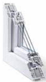
REHAU GENEÓ PHZ

U_f = 1,01 \text{ W/m}^2\text{K} U_w = 1,0 \text{ W/m}^2\text{K}