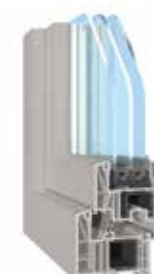
SALAMANDER BLUEEVOLUTION 82

U_f \geq 1,10 \text{ W/m}^2\text{K} U_w \geq 0,83 \text{ W/m}^2\text{K}