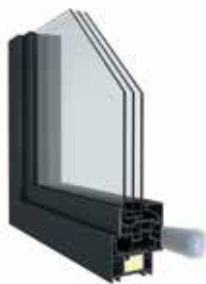
DECEUNINCK ELEGANT INFINITY THERMOFIBRA

LA CARPINTERÍA DE PVC Y EL PASSIVHAUS OCTUBRE 2022