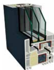
GEALAN CERTIFICATION KUBUS

U_f = 0,96 \text{ W/m}^2\text{K} U_w = 1,0 \text{ W/m}^2\text{K}