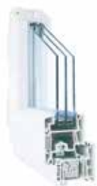
VEKAPLAST IBERICA SOFTLINE 76 PASSIV

El cumplimiento del estándar Passivhaus exige las clasificaciones máximas exigidas por el CTE en ensayos Aire, Agua y Viento