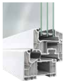
SCHÜCO SERIE LIVING 82 MD

U_f = 0,88 \text{ W/m}^2\text{K} U_w \geq 0,7 \text{ W/m}^2\text{K}