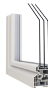
HOCO CONFORT 80

U_f = 0,92 \text{ W/m}^2\text{K} U_w = 0,98 \text{ W/m}^2\text{K}