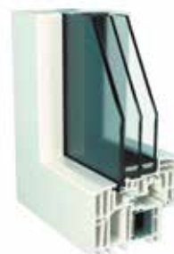
FINSTRAL TOP 90 NOVA LINE

U_f = 0,66 \text{ W/m}^2\text{K} U_w = 0,78 \text{ W/m}^2\text{K}