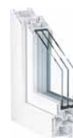
KOMMERLING KOMMERLING 76 AD XTREAM

U_f \geq 0,76 \text{ W/m}^2\text{K} U_w = 1,0 \text{ W/m}^2\text{K}