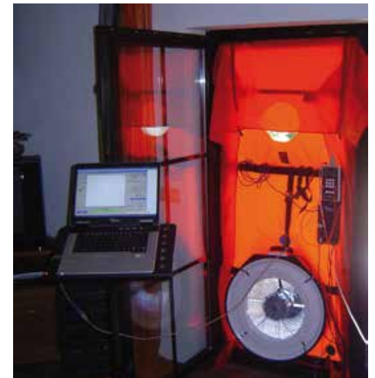
Realización del test de Blower Door [VAND arquitectura]

La envolvente exterior del edificio debe tener un resultado de la prueba de la presurización según EN 13829 inferior a 0.6 renovaciones de aire por hora