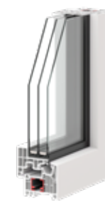
REPLUS RE 80 PVC I30 PREMIUM

U_f \geq 1,05 \text{ W/m}^2\text{K} U_w = 1,2 \text{ W/m}^2\text{K}